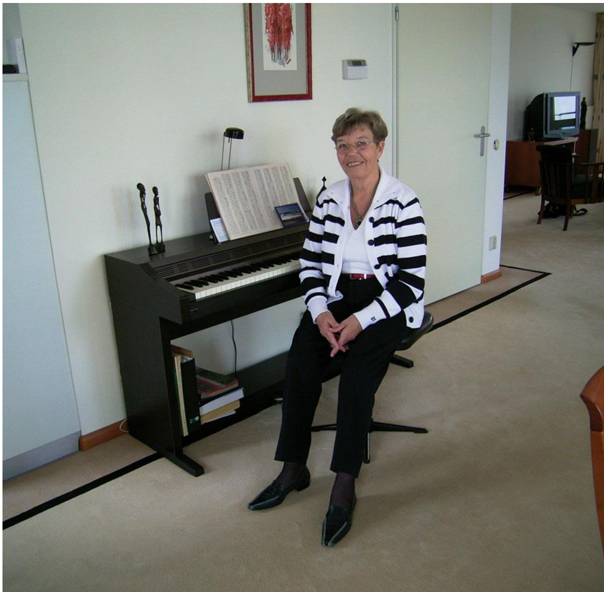
Een elektrische piano met een muziekboek in "Klaverscribo" boven het klavier.

De eerste computer was een enorm gevaarte, groter dan een wasmachine, en stond in de kluis. Onvoorstelbaar als je bedenkt dat de tegenwoordige computers in een handtas passen. Alle gegevens via ponskaarten over zetten in het computersysteem was een hele klus. Maar denk niet dat daarmee de ellende voorbij was, nee die begon toen pas want een computer is